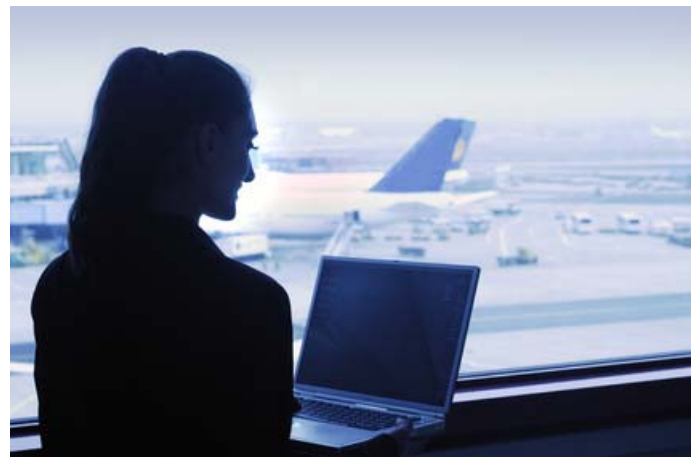
Dienstreisen mit dem Laptop, mobiler Zugriff auf Firmendaten – eine Herausforderung auch für den Arbeitnehmerdatenschutz

An anderen Stellen besteht hingegen noch Bedarf für Ergänzungen und Klarstellungen. Der Deutsche Führungskräfteverband fordert unter anderem klare definierte Anforderungen an einen Arbeitgeber, der seine Personalverwaltung auf eine elektronische Personalaktenführung umstellen möchte.