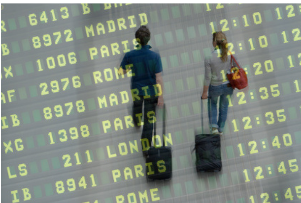
Arbeiten im Ausland? Der von der EU-Kommission geplante neue „Berufsausweis“ soll die Anerkennung von Berufsabschlüssen vereinfachen.

Der Europäische Führungskräfteverband CEC – European Managers hat die Vorschläge der Kommission, insbesondere die Aufwertung des Berufsausweises, begrüßt und hierbei insbesondere auf eine im Vergleich zu anderen Berufsgruppen überdurchschnittliche Mobilität hingewiesen.